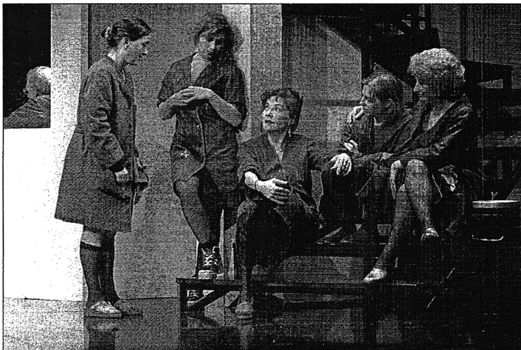
Quemar incienso dispersa el mal, decían los libros de Benet, y lo decía también una bruja que habían llevado a los ensayos como asesora.

La compañía encara el futuro con confianza.