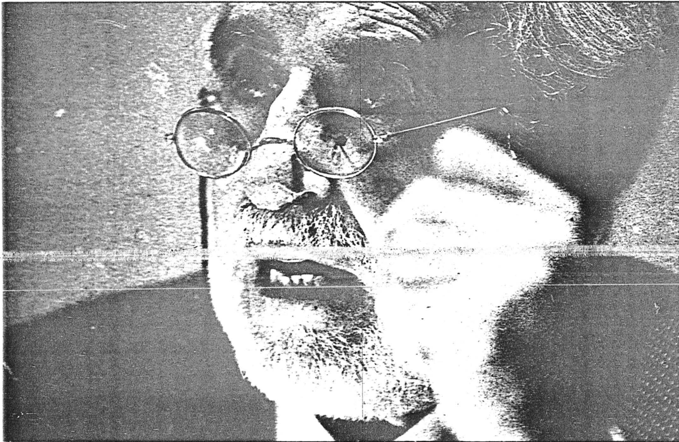
Carlos Castilla del Pino.