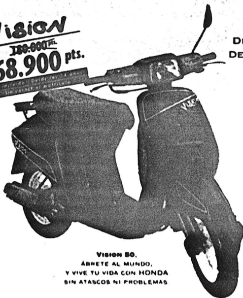
VISION 50. ÁBRETE AL MUNDO. Y VIVE TU VIDA CON HONDA SIN ATASCOS NI PROBLEMAS