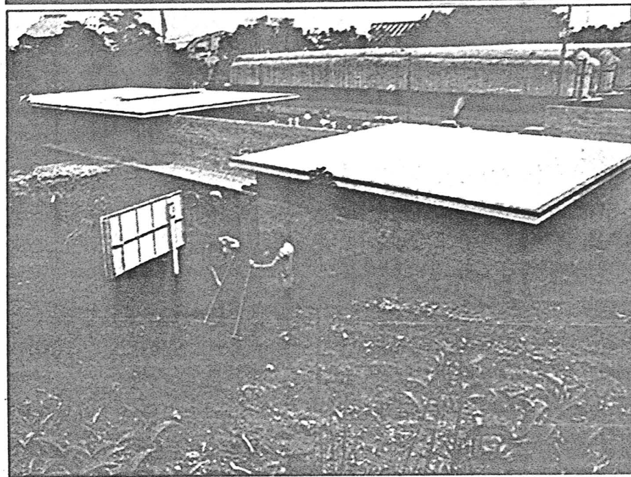
El Pabellón Mies van der Rohe luce con todo su esplendor (arriba), tras la demolición del edificio del INI (abajo).

la voluntad, muy personalmente asumida, del alcalde Maragall. Así, ahora, "el pabellón [transcribamos la memoria de los arquitectos Aguilera y Marqués, por una vez la prosa de arquitecto ceñida al sobrio modelo que la inspira] se verá envuelto lateralmente por la sucesión de columnas salomónicas esgrafiadas en el pabellón Victoria Eugenia y en su parte posterior por la vegetación abrupta de la montaña que nos vincula inexorablemente a aquella cabaña primitiva que Laugier [arquitecto y jesuita francés del siglo XVIII, teorizador del neoclasicismo en la arquitectura] emulara. El pabellón, con más intensidad que la que le es inherente, resurgirá entre este bosque de columnas, reafirmando tajantemente su esencia primera, su condición de atemporalidad".