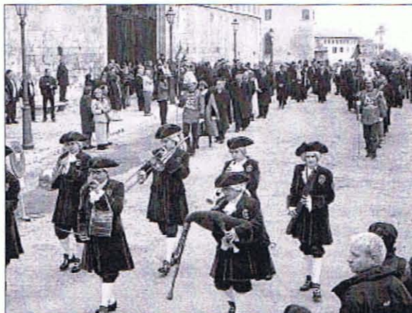
Imagen de la reciente conmemoración de la conquista catalana de Mallorca.

Había gente muy entusiasmada con la idea de que el PP se fuera a la oposición en Balea-