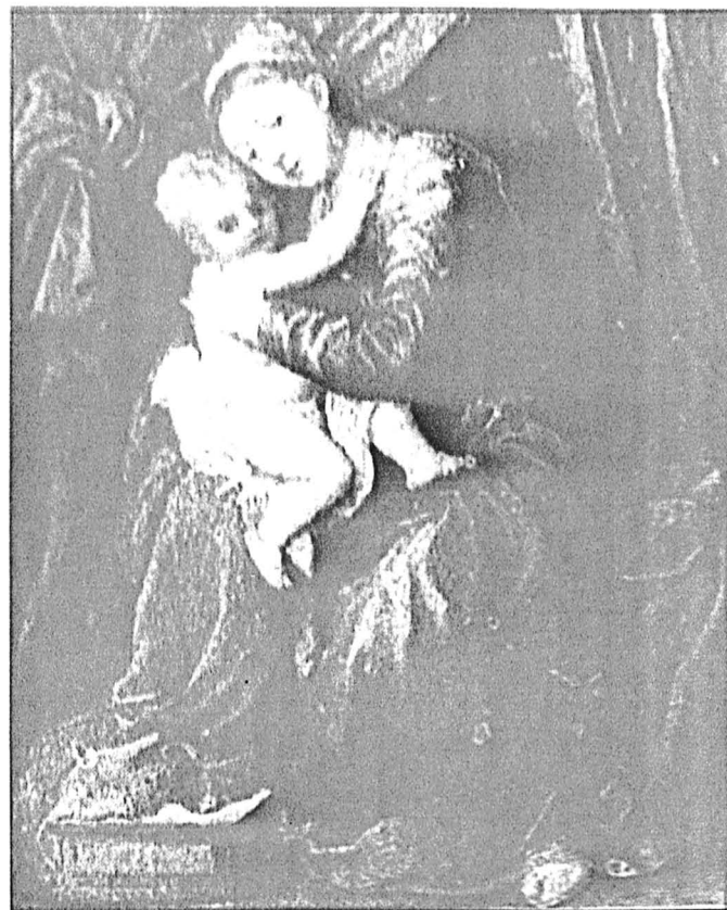
A la izquierda, fotografía del lienzo La Virgen con el Niño , Ilgur. El Museo Thyssen de Pedralbes. El