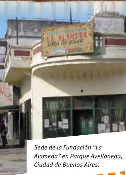
Sede de la Fundación "La Alameda" en Parque Avellaneda, Ciudad de Buenos Aires.