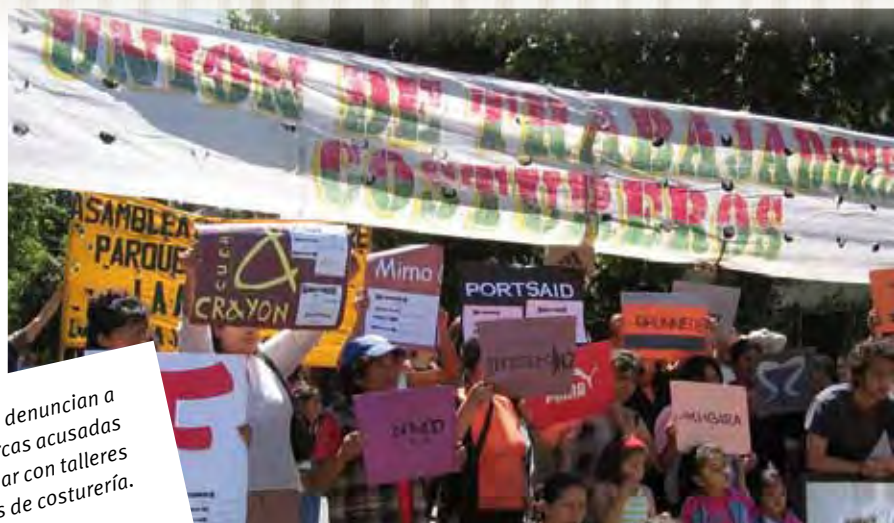
Manifstantes denuncian a las marcas acusadas de trabajar con talleres clandestinos de costurería.

que fueron descubiertos recientemente en campos de semilleras. Todos vienen de Santiago del Estero, donde hay una desocupación estructural, donde la gente vive de los planes sociales. Los mismos punteros que les dan los planes, negocian venderlos al mejor postor con las agencias de colocación.