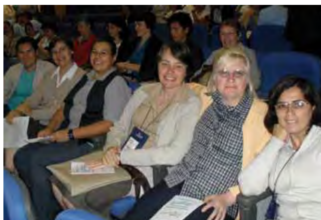
las HMA en el encuentro de Cachoeira do Campo.