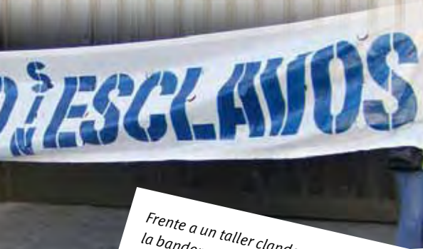
Frente a un taller clandestino, la bandera con la frase que identifica la lucha de La Alameda.