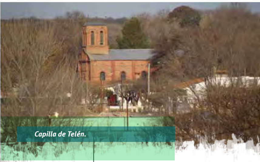
Capilla de Telén.

experiencia única, ya que por un lado no existe otra en el mundo pero por otro, y más importante es que se fortaleció el sentido de comunidad y nos enseñó que debemos ayudarnos cada día más”.