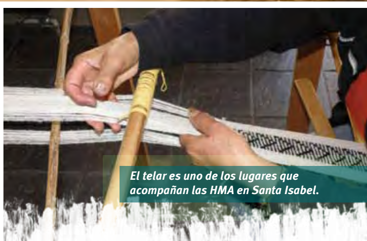
El telar es uno de los lugares que acompañan las HMA en Santa Isabel.