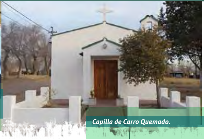
Capilla de Carro Quemado.

La animación de los jóvenes es uno de los propósitos que persigue la misión en el oeste pampeano.