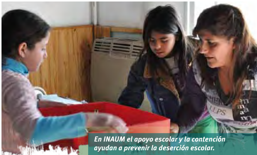
En INAUM el apoyo escolar y la contención ayudan a prevenir la deserción escolar.