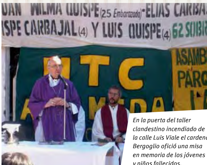
En la puerta del taller clandestino incendiado de la calle Luis Viale el cardenal Bergoglio ofició una misa en memoria de los jóvenes y niños fallecidos.